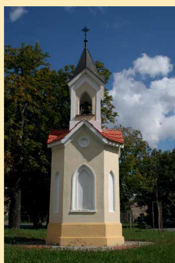
Zvonička na bývalé dušnické návsi