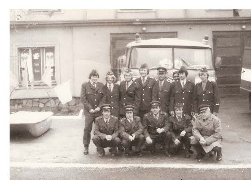
Hasičský sbor roku 1978