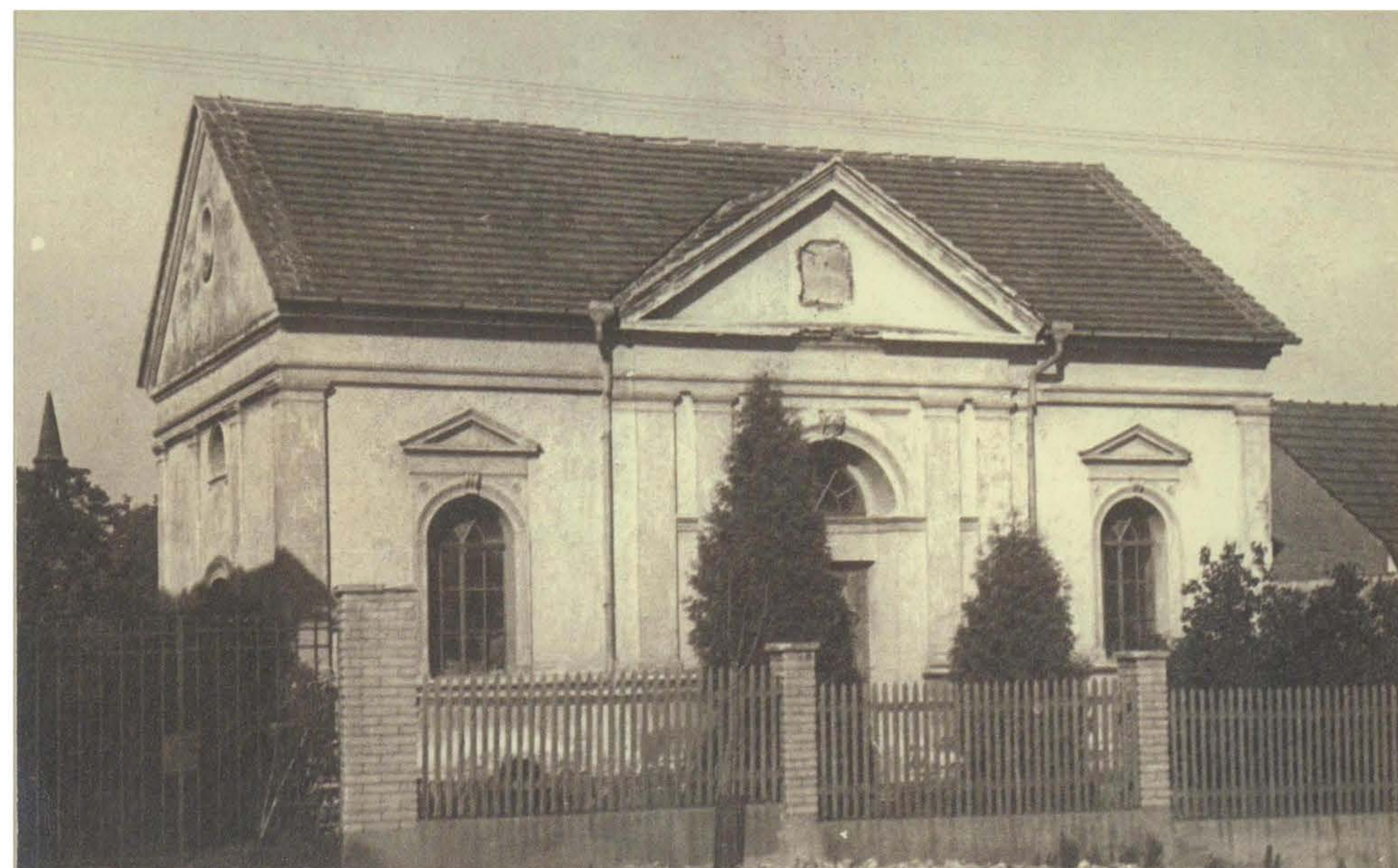
Litenská synagoga před přestavbou

Liteňští páni byli k Židům poměrně vstřícní, takže si roku 1715 mohli zřídit školu (do té doby učil židovské děti Izrael Hirsch ve své chalupě). To také znamenalo trvalou přítomnost Židů na tomto panství. V 17. a 18. století se jejich počet na venkově zvětšoval, což mělo za následek růst a bohatnutí obcí. Ovládali nejen obchod a finance, ale i řemesla. Tomuto vývoji nepřála města, kde obchod v důsledku rozptýlení po malých obcích slábl. Mnozí se snažili působení Židů bránit. Bylo například nařízeno, jak daleko má být nejbližší židovské obydlí od kostela. Díky tomuto nařízení se zachovalo mnoho plánek malých měst a větších obcí. Z plánu Litně lze zjistit, že jeden židovský dům stál v místech nynějšího domu č.p. 63 - postavil jej pro rodinu Daniel Bareus. Druhý je dosud stojící sýpka postavená Židem Herschetem.