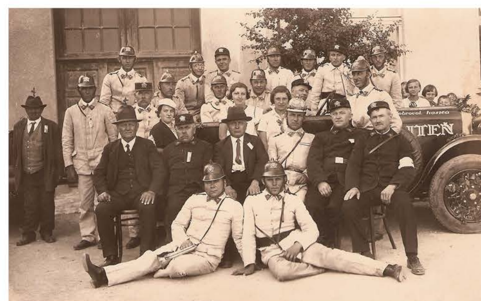
Hasiči při přebírání stříkačky

1680 – založení hřbitova 1715 – zřízení školy 1867 – postavení nové školy 1880 – postavení nové synagogy 1942 – deportace Židů do Osvětimi 1956 – adaptace na hasičskou zbrojnicu