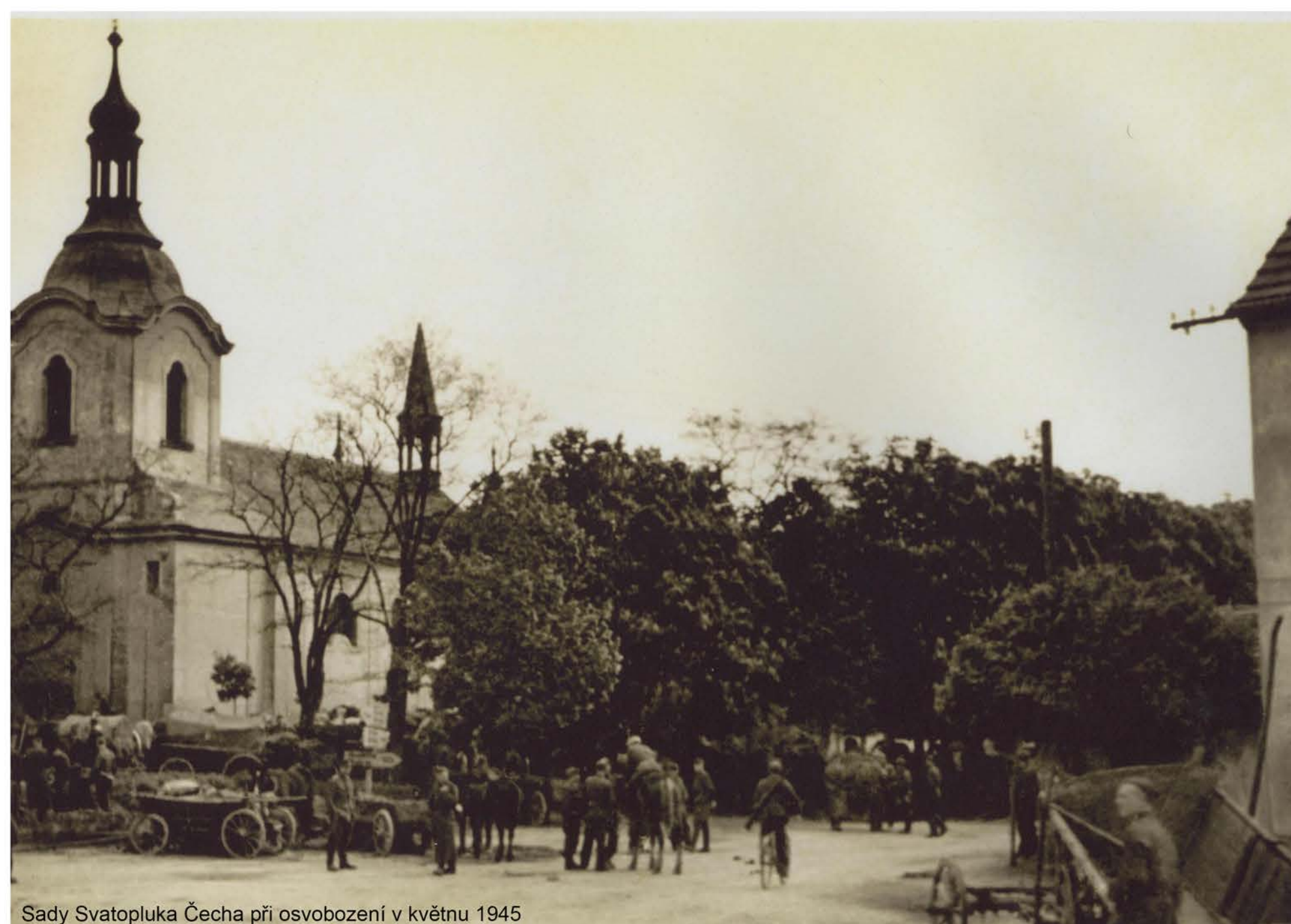
Sady Svatopluka Čecha při osvobození v květnu 1945

Traduje se, že kostel svatého Petra a Pavla v Litni nechal Karel IV. postavit ze zbylých kamenů po stavbě hradu Karlštejn. Pravděpodobně byla v tomto místě dříve románská kaple či rotunda. V roce 1639 byl vypálen švédskými vojsky. Po třicetileté válce byl opravován v roce 1661. V letech 1765 - 67 byl přestavěn do dnešní barokní podoby. V roce 1906 byla přistavěna věž. Je chráněn jako kulturní památka České republiky. Podlaha kruchty je ve výšce 3,8 metru nad podlahou lodi a je dřevěná. Varhany byly postaveny Josefem Hubičkou z Prahy-Smíchova pod opusovým číslem 48. Mají jeden manuál, pedál, 8 znějících rejstříků a pedálovou spojku. Kazatelna není na levé, ale na pravé straně a nachází se v rohu mezi jižní a východní zdí. Byla postavena v roce 1772.