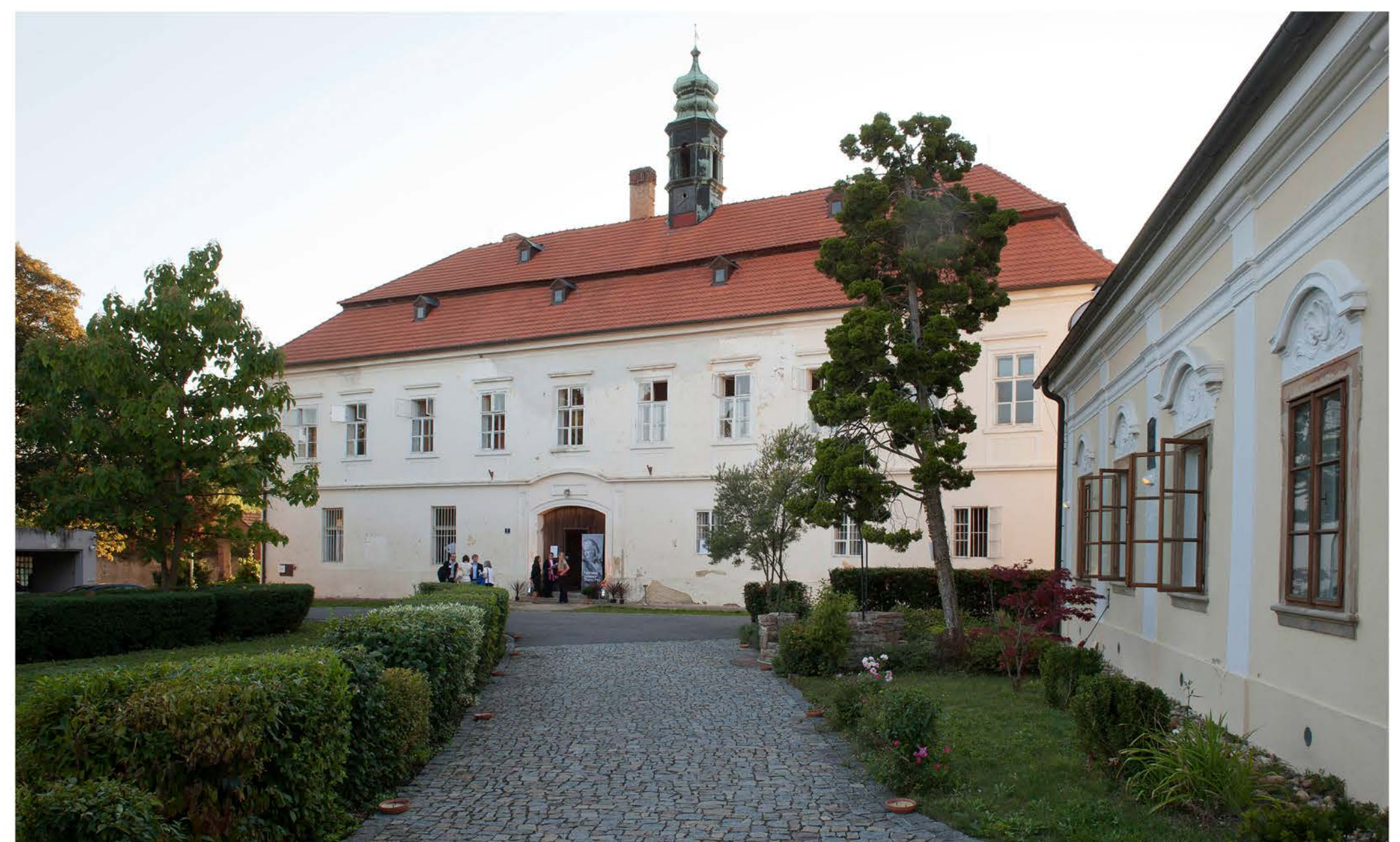
Dnešní podoba zámku