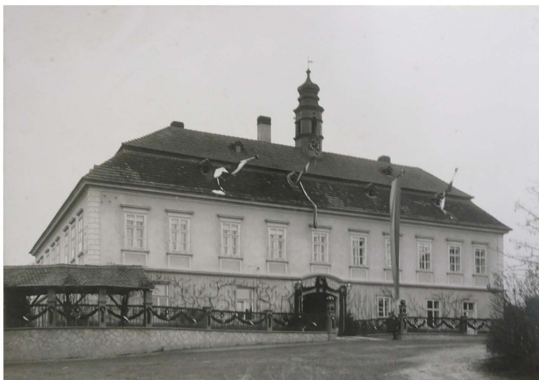
Zámek se "špacirzónou"