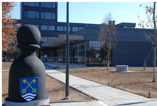
Černý pěšec před pivovarem v Letech

Putujte s královskou hrou po královském regionu, sbírejte razítka a zapojte se do hry o ceny. Aktuální podmínky soutěže naleznete na internetu.