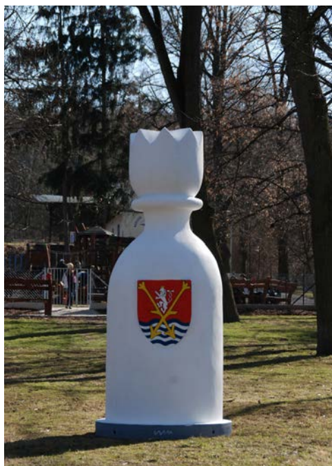
Bílý král v Řevnicích

Karlštejnsko je nejstarší turistický region. Jako místo pro svůj hrad si ho kdysi vybral císař a král Karel IV., vede tudíž nejstarší turistická stezka Vojty Náprstka. Cesta z Prahy sem trvá jen pár minut. Najdete zde kromě malebné krajiny i množství přírodních a kulturních památek. Sportovci ocení značené cyklotrasy, skály, golfová hřiště a lanové centrum, pro milovníky kultury, historie a umění jsou tu muzea s místními zajímavostmi. Těšíme se na vaši návštěvu.