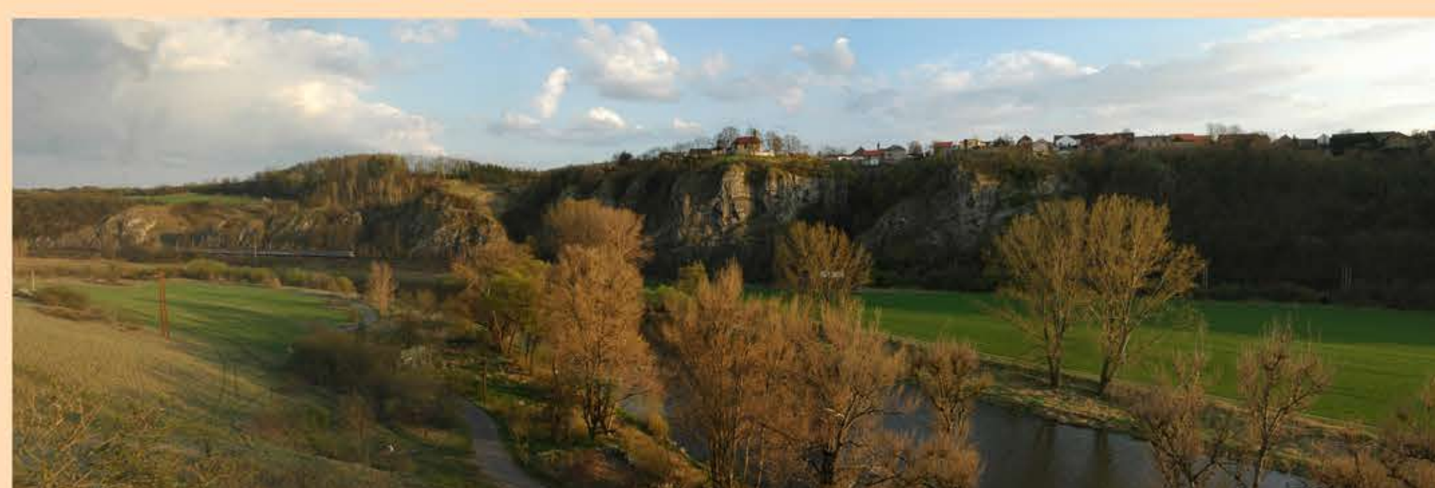
Pohled od Berouna

Ale zpět k realitě. Pokud se na Damilu něco z pověstí opravdu odehrálo nevíme, ale lidé se zde pohybovali od nepaměti, jak o tom svědčí nálezy kamenných seker z mladší doby kamenné. Ještě v 1. polovině 20 století byl povrch Damilu tvořen převážně lukami. Dnes je částečně zalesněn.