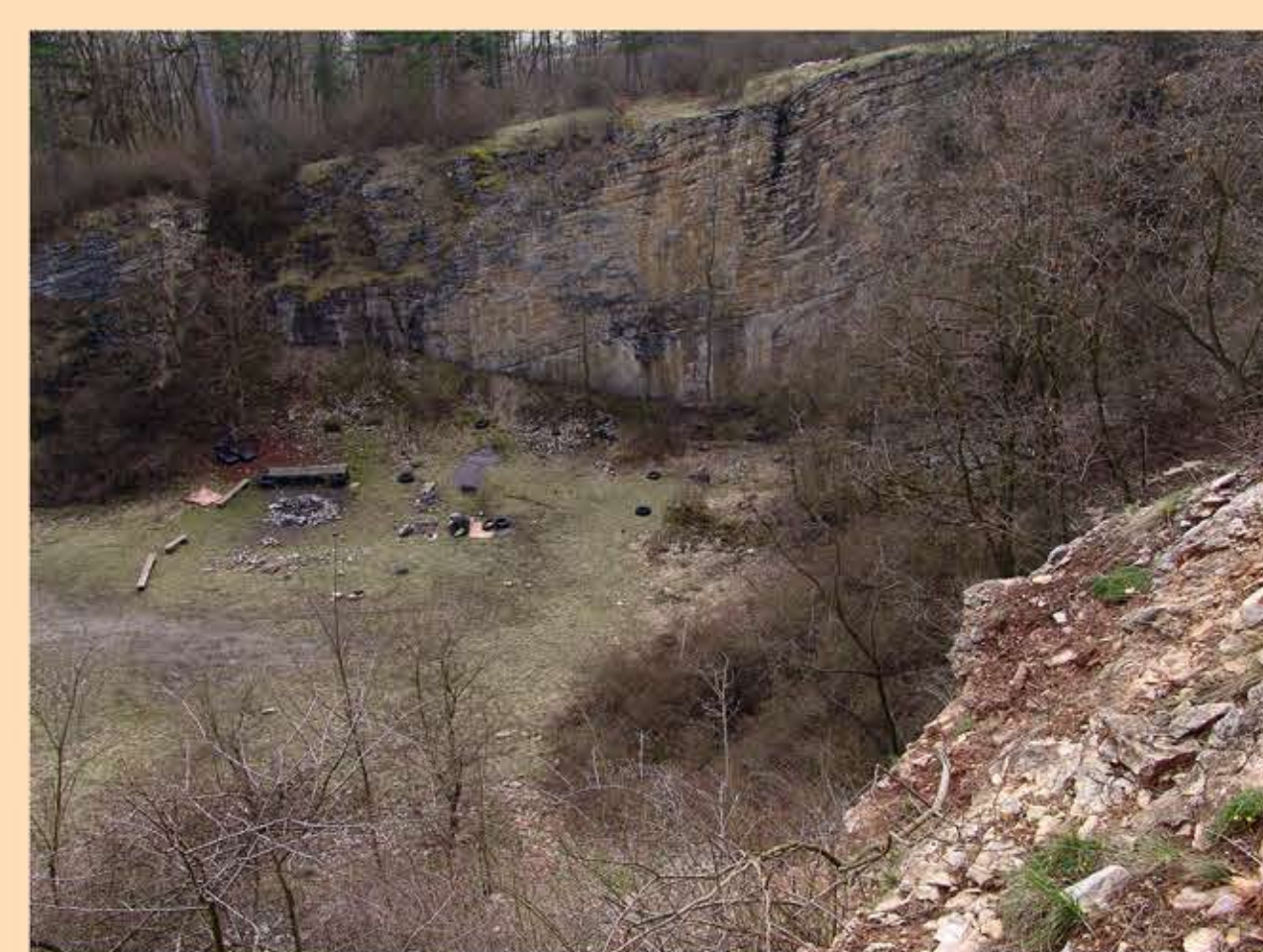
Lom Na Krětě