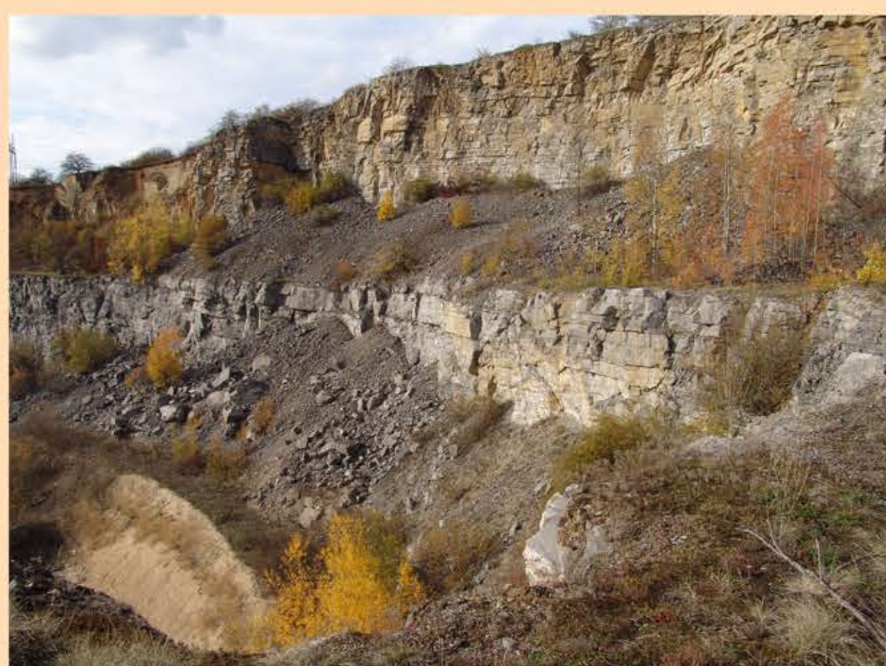
Nový bílý lom