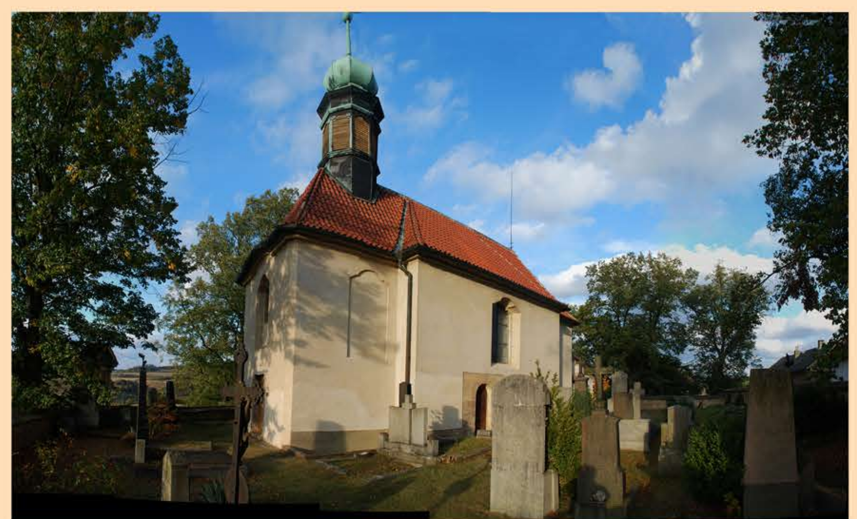
Kostel sv. Jana Nepomuckého

7. První tetínská škola byla zřízena v roce 1737 v rodinném domku poblíž kostela sv. Ludmily. Svému účelu sloužila až do roku 1835, kdy byla nová školní budova postavena na farské zahradě. V roce 1888 byla poblíž postavena nová školní budova, která po několika přestavbách a rekonstrukcích slouží svému účelu dodnes.