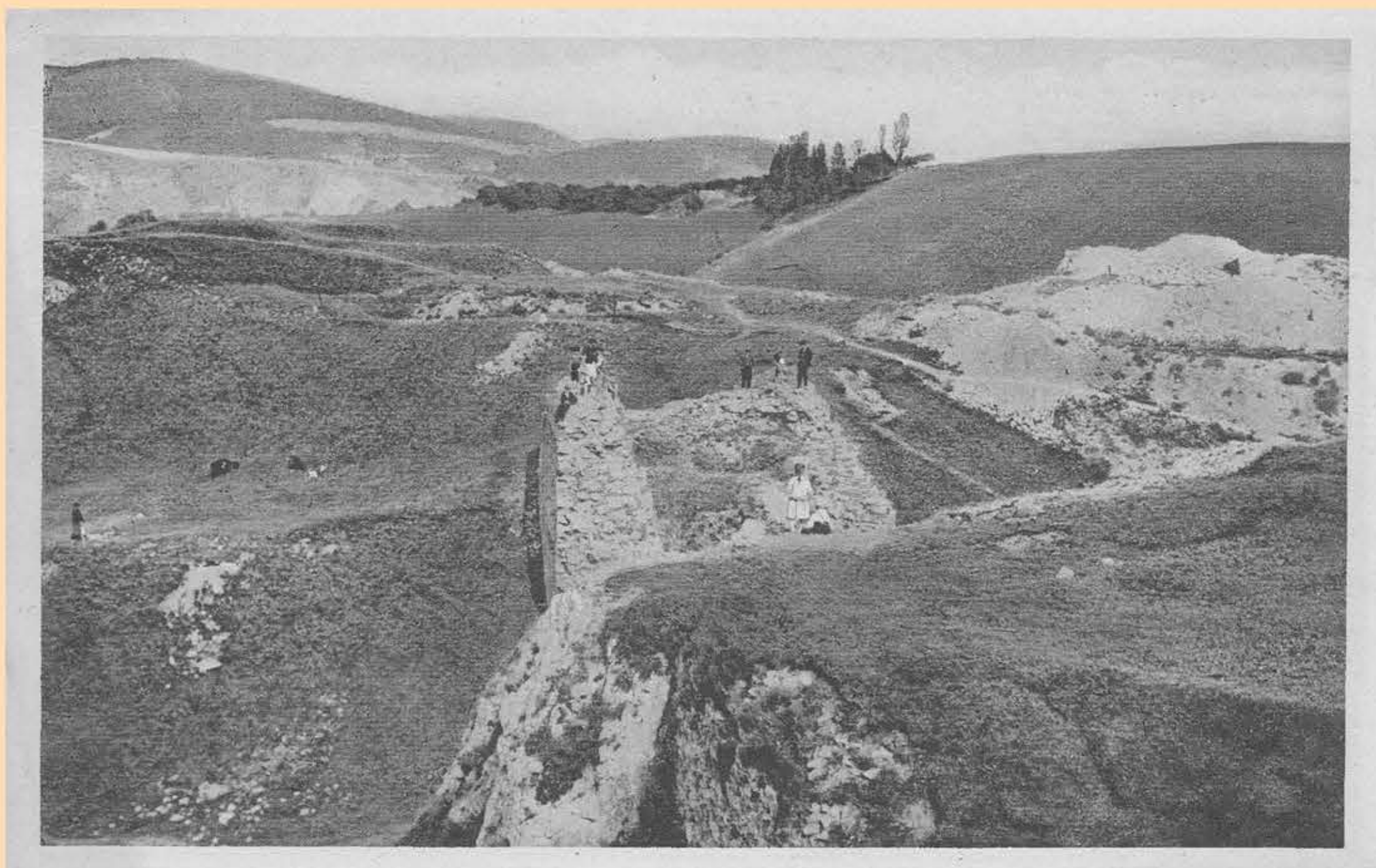
Ostrožna hradu odtěžená počátkem 20. století

Dobu železnou na Tetíně zastupuje kultura halštatská, laténská (Keltové) a římská.