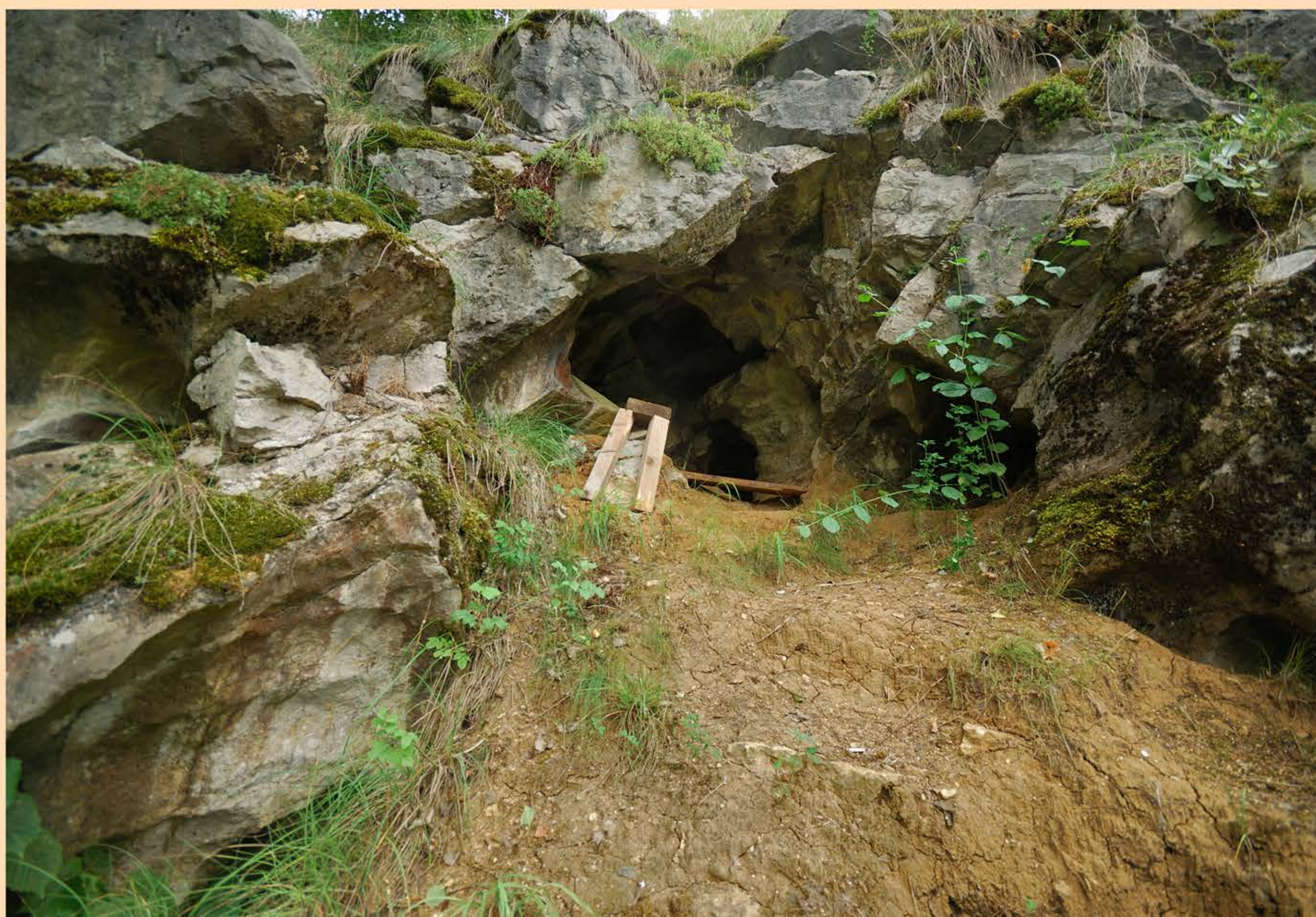
Turské Maštale - současný stav

Kromě paleolitických lovců a sběračů žili na Tetíně v mladších obdobích pravěku i zemědělci, pastevci a řemeslníci. Na základě nálezů můžeme předpokládat, že Tetín je osídlen nepřetržitě od počátku zemědělské civilizace v Čechách, tj. od 6. tisíciletí před naším letopočtem. Neolitické osídlení bylo z kultur s lineární a vypíchanou keramikou.