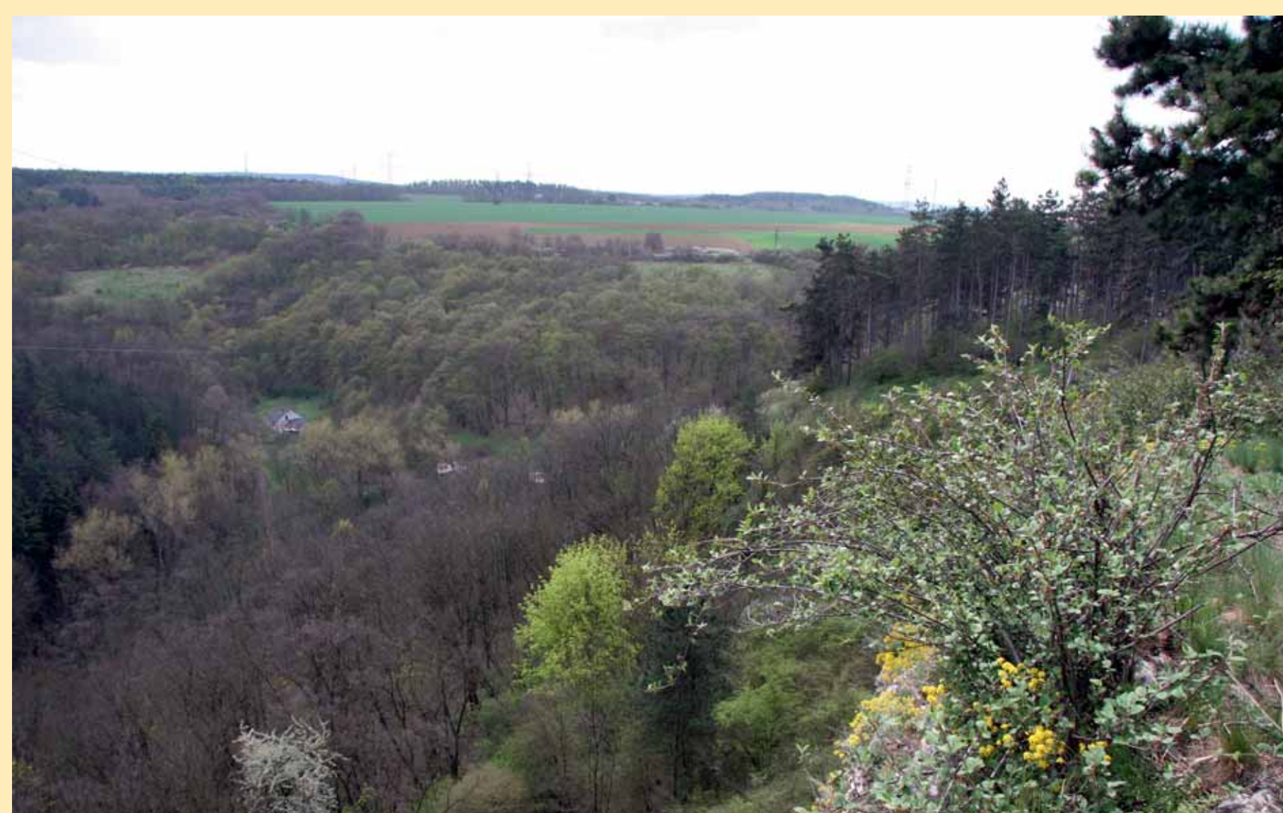
Pohled k vysílači Cukrák