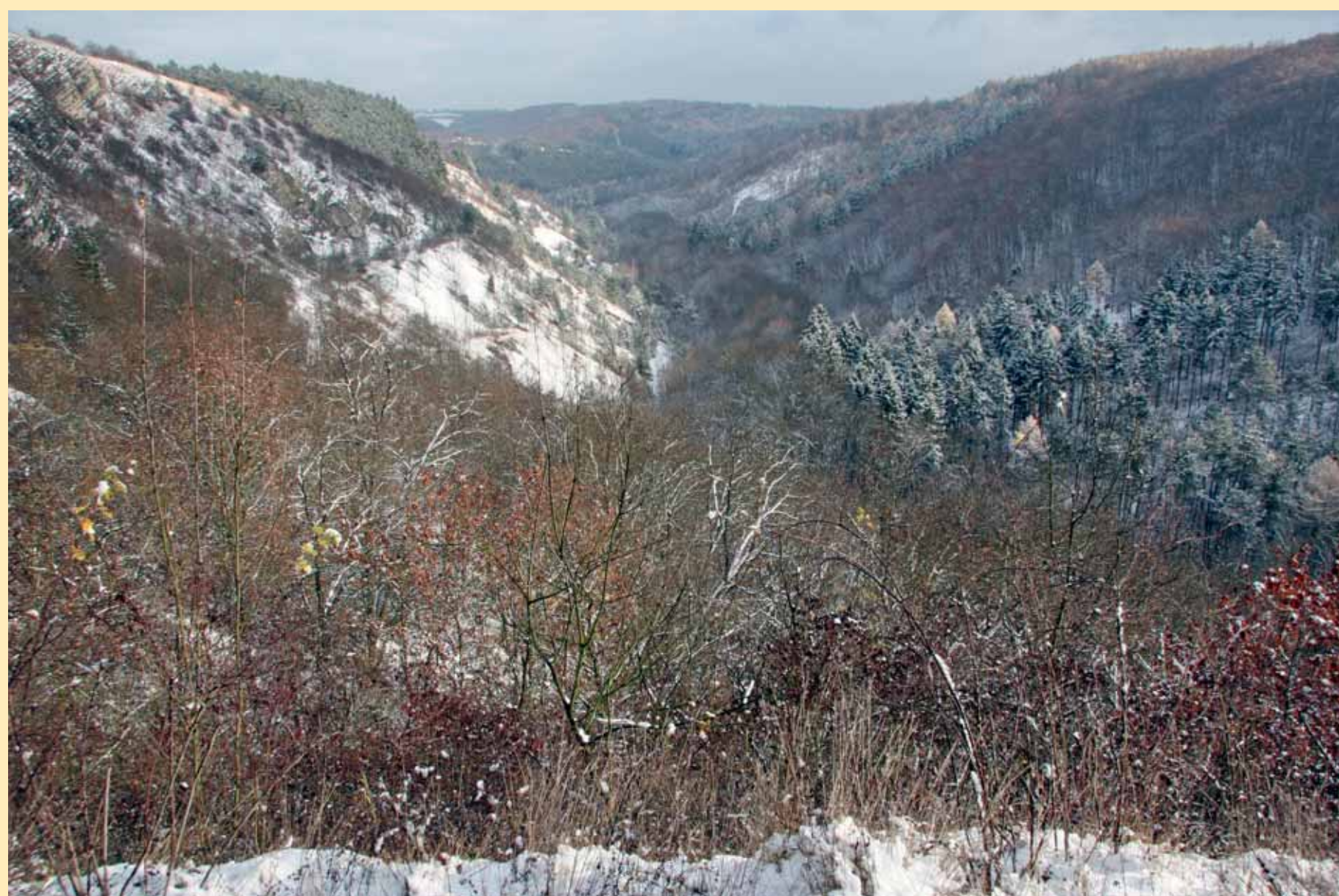
Údolí národní přírodní památky Černé rokle