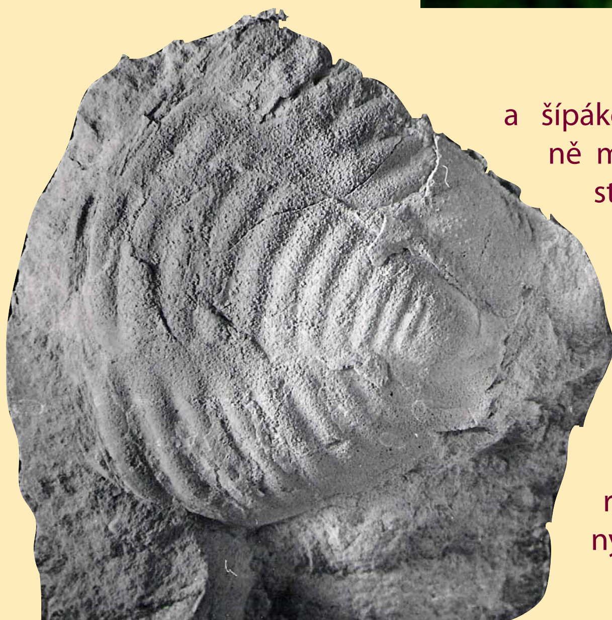
Trilobit Parahomalonothus Novaki