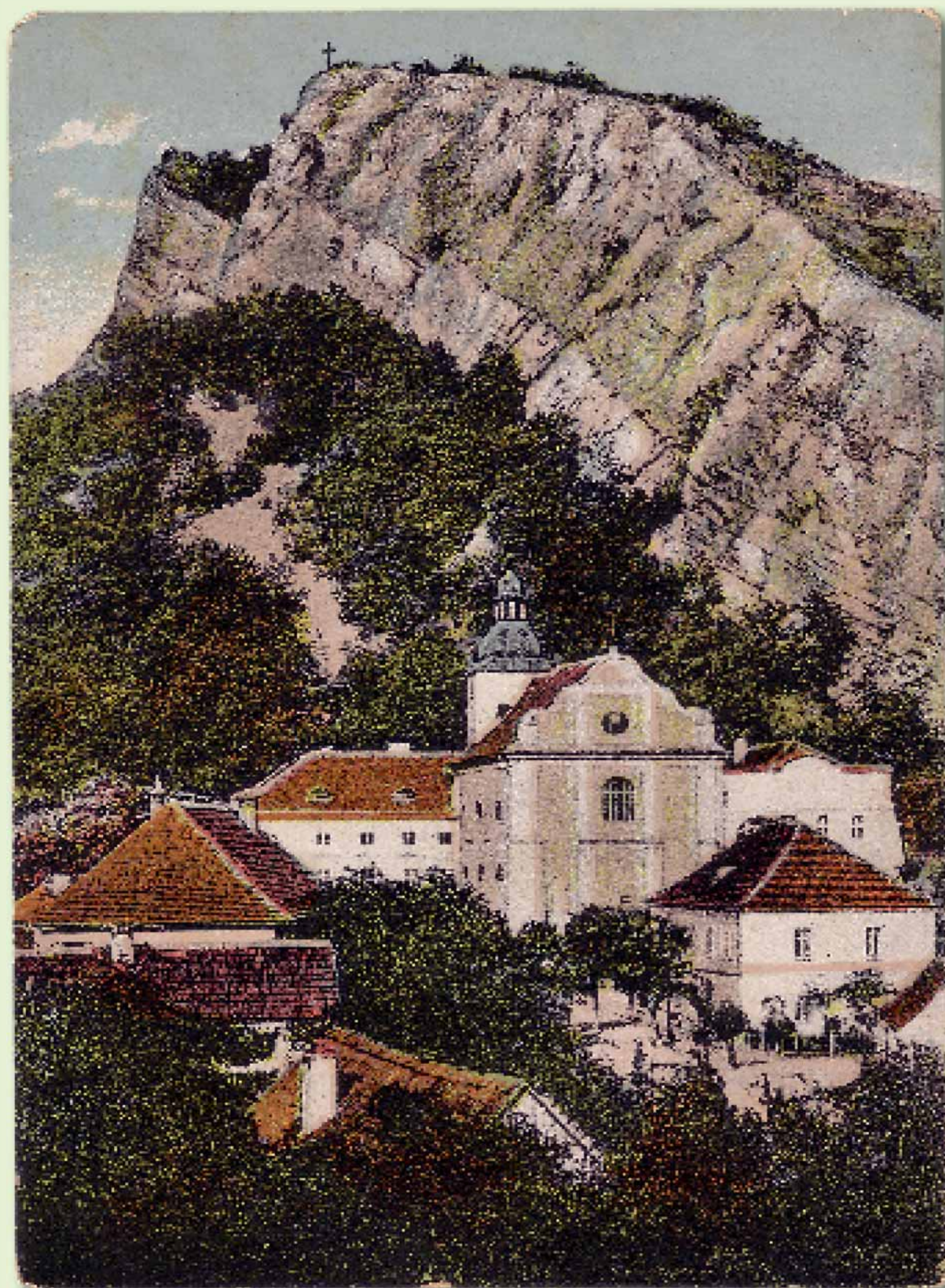
Pohlednice z roku 1910