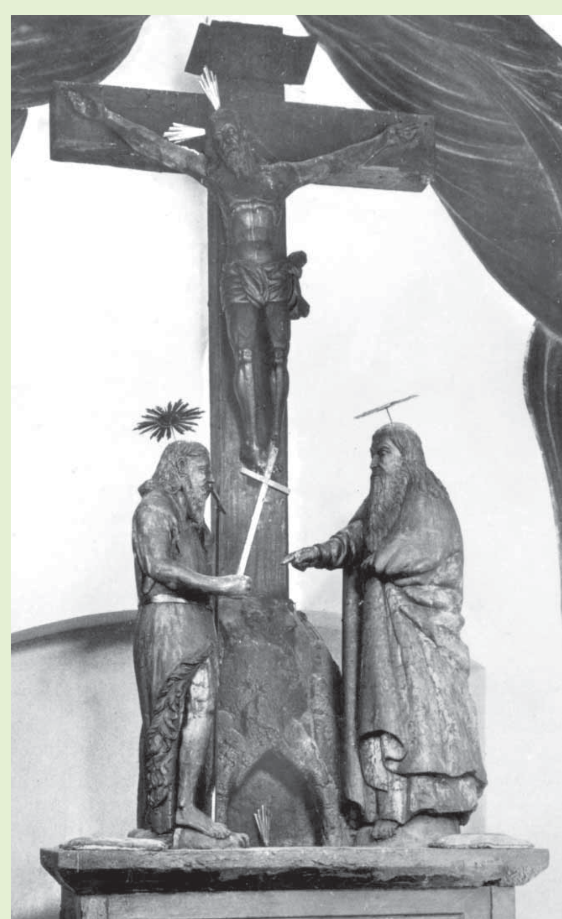
Původní podoba sousoší před odstraněním nekamenných prvků ze soch.