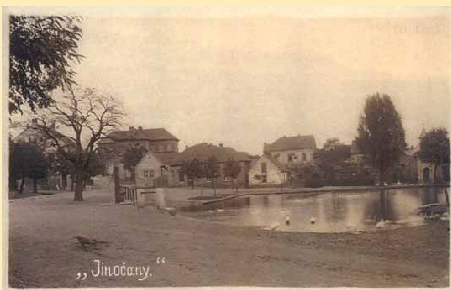
Historický pohled – náměstí

Jinočany byly oblíbeným místem k životu a dobrou adresou jak v mladší době kamenné tak i bronzové. Dosvědčují to bohaté archeologické nálezy na území obce, které jsou součástí sbírek okresního muzea – expedice Závist. Jedná se o nálezy keramiky, nástrojů, šperků a zbraní. Obec se nachází v pásmu Barrandienu jsou ve sbírkách zastoupeny i nálezy zkamenělin. První domy vyrostly okolo pramene na náměstí, který napájí dnešní rybník. Právě zde stávala poustevna, která dala obci jméno (od staročeského jinok neboli poustevník). Později přetvořeno na ves lidí bydlících v Jinocích, tedy Jinočany.