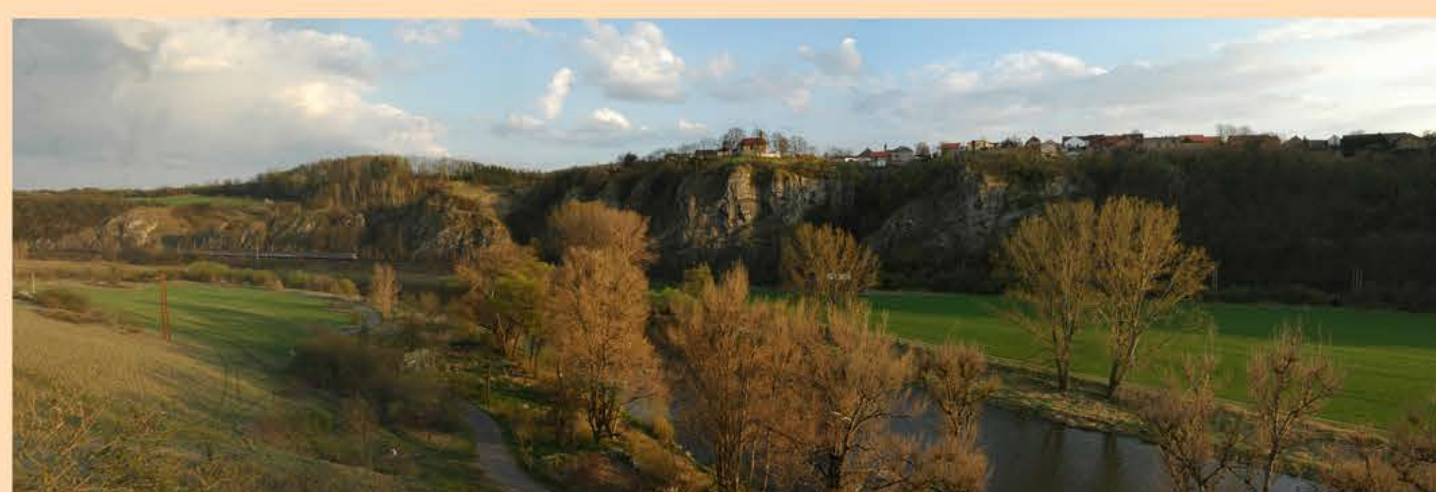
Pohled od Berouna

Ale zpět k realitě. Pokud se na Damilu něco z pověstí opravdu odehrálo nevíme, ale lidé se zde pohybovali od nepaměti, jak o tom svědčí nálezy kamenných seker z mladší doby kamenné. Ještě v 1. polovině 20 století byl povrch Damilu tvořen převážně lukami. Dnes je částečně zalesněn.