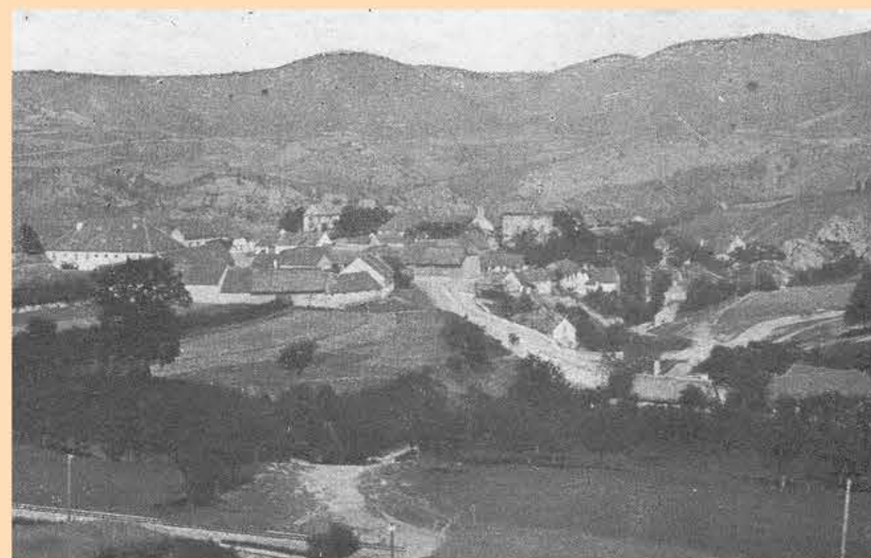
Počátek 20. století

Od konce 2. světové války dochází k úbytku obyvatel, který trval v podstatě až do konce 20. století. Až v posledních letech začíná počet obyvatel Tetína stoupat.