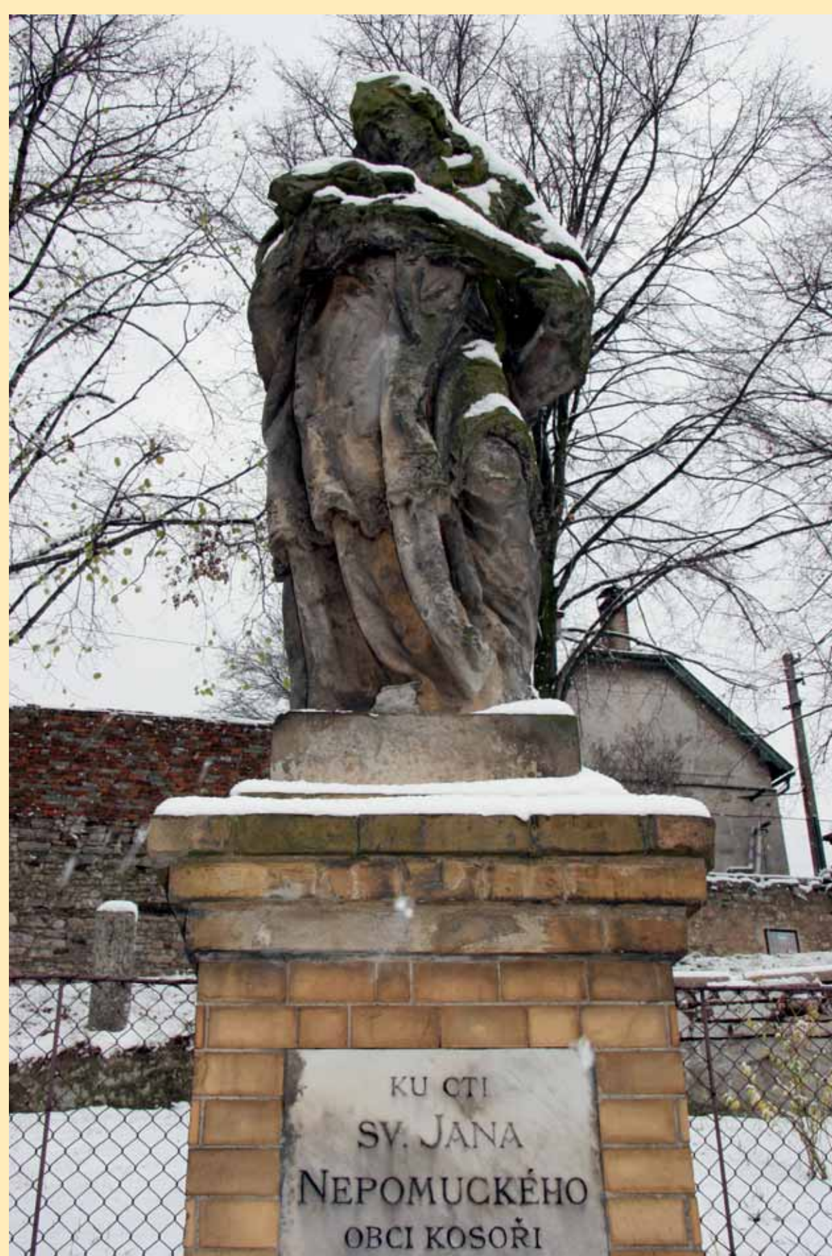
Socha sv. Jana Nepomuckého