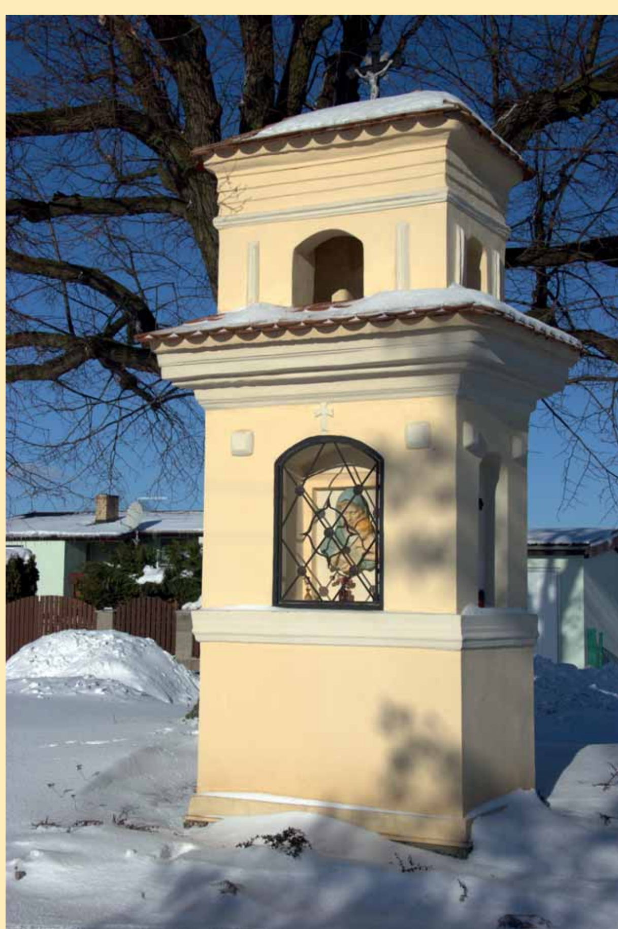
Kaplička v Kosoři