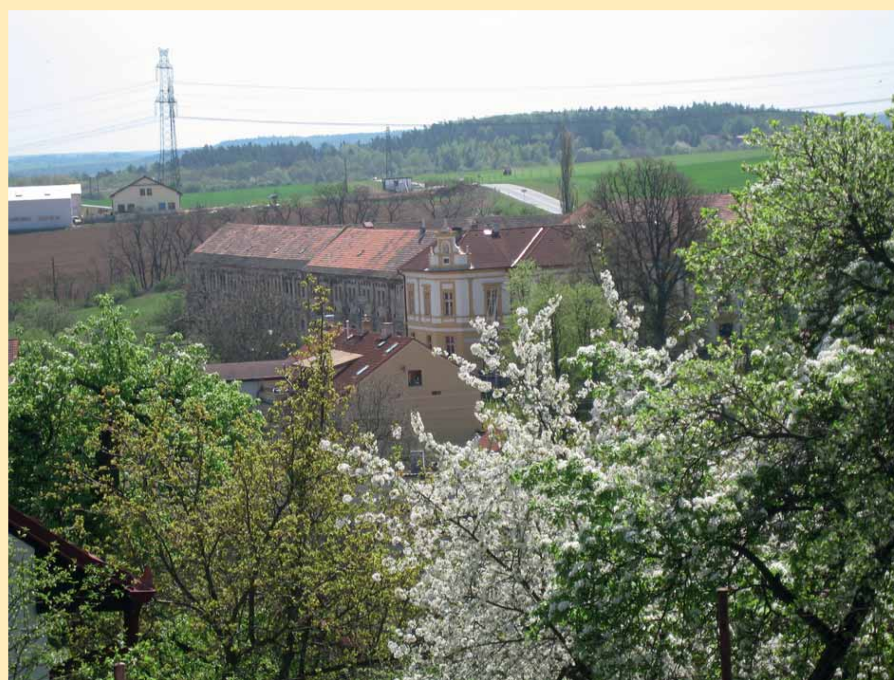
Areál kosořského dvora

z roku 1787 udává, že obec měla 31 č. p., velký rozvoj výstavby nastal po roce 1948. Jako významnou událost můžeme považovat v roce 1881 rozhodnutí povolit odškolnění obce Kosořské od obce Třebovské a povolení ke stavbě školy. Škola byla dokončena 1. října roku 1882. V obci byl založen sbor hasičů roku 1889. V říjnu 1895 byla v obci postavena socha svatého Jana Nepomuckého, která je evidována jako národní kulturní památka. Kolem roku 1900 byl postaven veřejný obecní vodovod, čerpání bylo na větrný pohon. Na všech uvedených akcích se aktivně podílela Vyšehradská kapitula, jejíž zásluhou byla v roce 1885 postavena i nová silnice. V roce 1848 měla obec 47 stavení a 402 obyvatel. V roce 1890 měla 57 stavení a 534 obyvatel. V roce 2004 měla obec 260 č. p. a 712 trvale hlášených obyvatel, v roce 2010 má obec č. p. 297 a 887 trvale hlášených obyvatel.