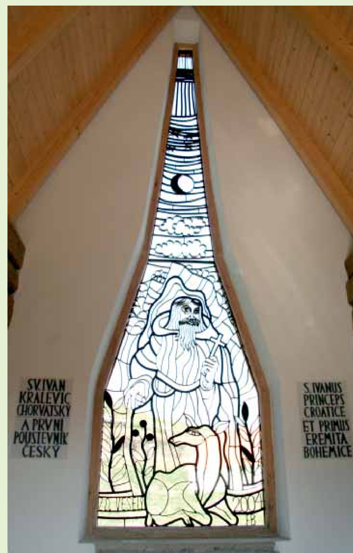
Okenní mříž v kapli sv. Ivana

V ní je vsazena 4,25 m vysoká kovaná okenní mříž s obrazem sv. Ivana, jeho laně a svatojánské skály v pozadí (podle návrhu akad. malíře Zdeňka Veselého z Teplic mříž vytvořil František Burian). Prostor samotné kaple tvoří jediná místnost, kterou vymezuje masivní dřevěné roubení. V jejím průčelí je pod otevřenou mříží osazena mramorová oltářní menza. Kaple byla postavena svépomocí z peněžitých darů občanů a příznivců tohoto místa a byla slavnostně posvěcena 24. června 2007.