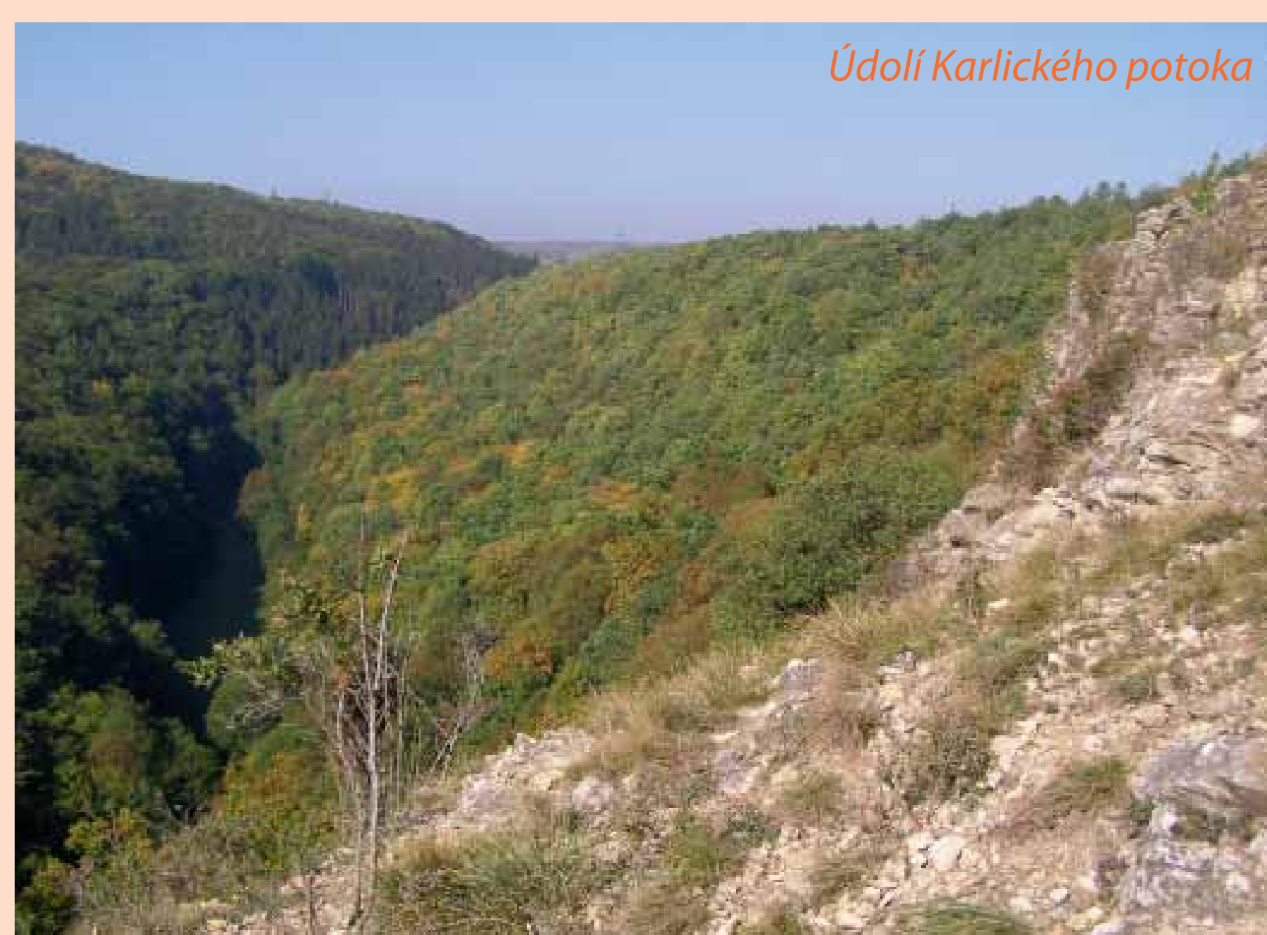
Údolí Karlického potoka

ho zdiva a nepřehlédnutelný příkop. V minulosti navštívil ruiny nejeeden hledač pokladů. Váben pověstí, že jedině o pašijích bylo možné dosáhnout pokladů, neúnavně kopal a kopal, ale když se dostal až k němu, uslyšel volání: „Mořinka hoří!“ Odběhl se podívat, ale poklad mezitím zmizel.