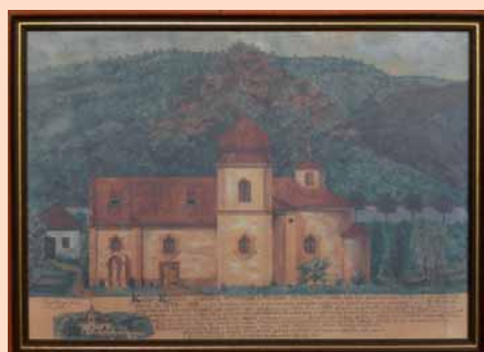
Podoba kostela před rokem 1889

Nacházíte se na historicky nejstarším místě této oblasti. Několik nálezů v okolí karlického hřbitova a jeho okolí, které jsou uloženy v depozitáři dobřichovické školy, svědčí osídlení tohoto místa v době kamenné. Jsou to především: zlomek provrtané sekyrky, kostěná jehla a různé nádoby a střepy z doby asi 2 000 let před Kristem. Častější jsou pak nálezy z doby bronzové. Její první období, kultu-