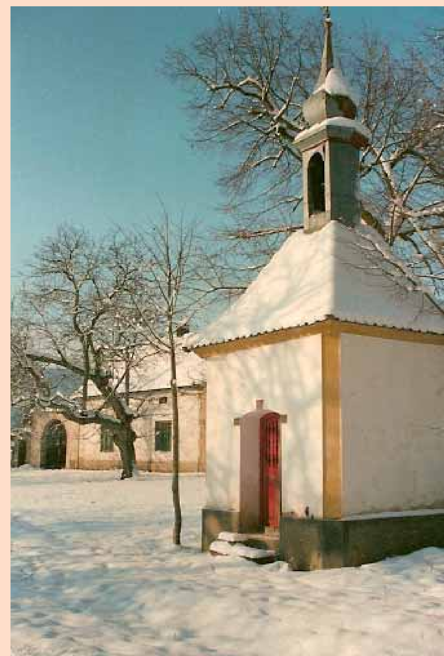
Kaplička v zimě