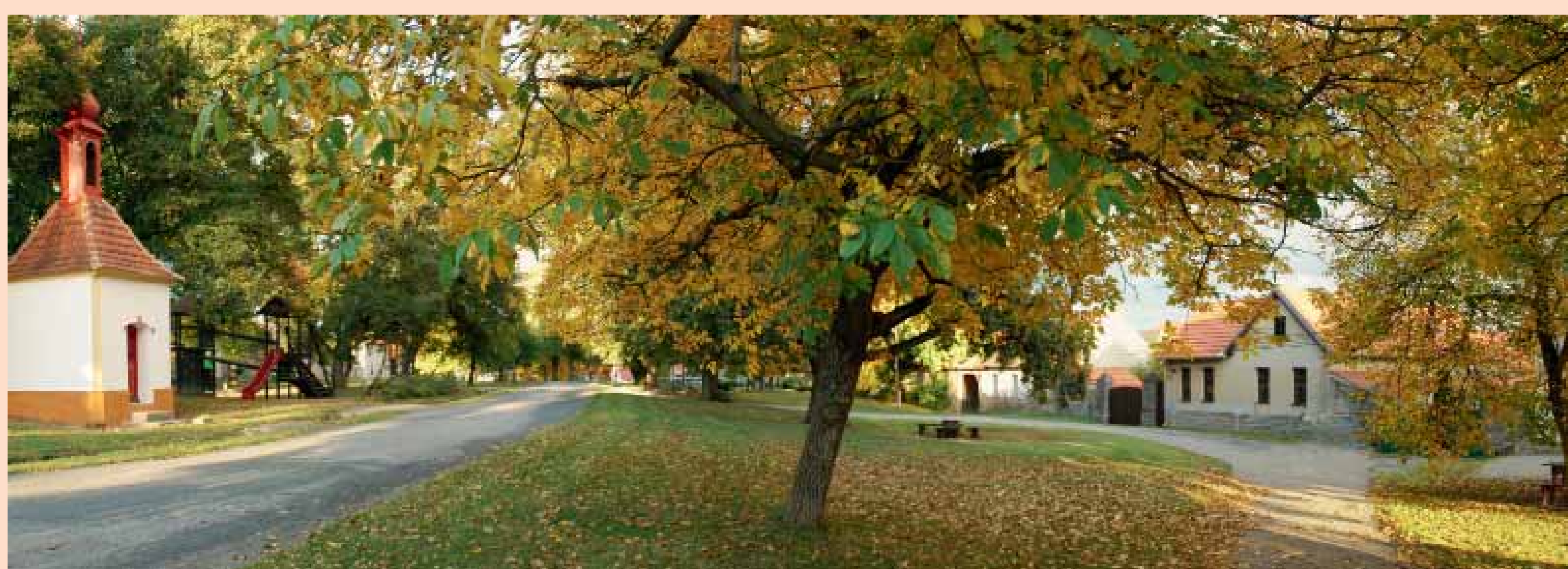
Vesnická památková zóna na Mořince