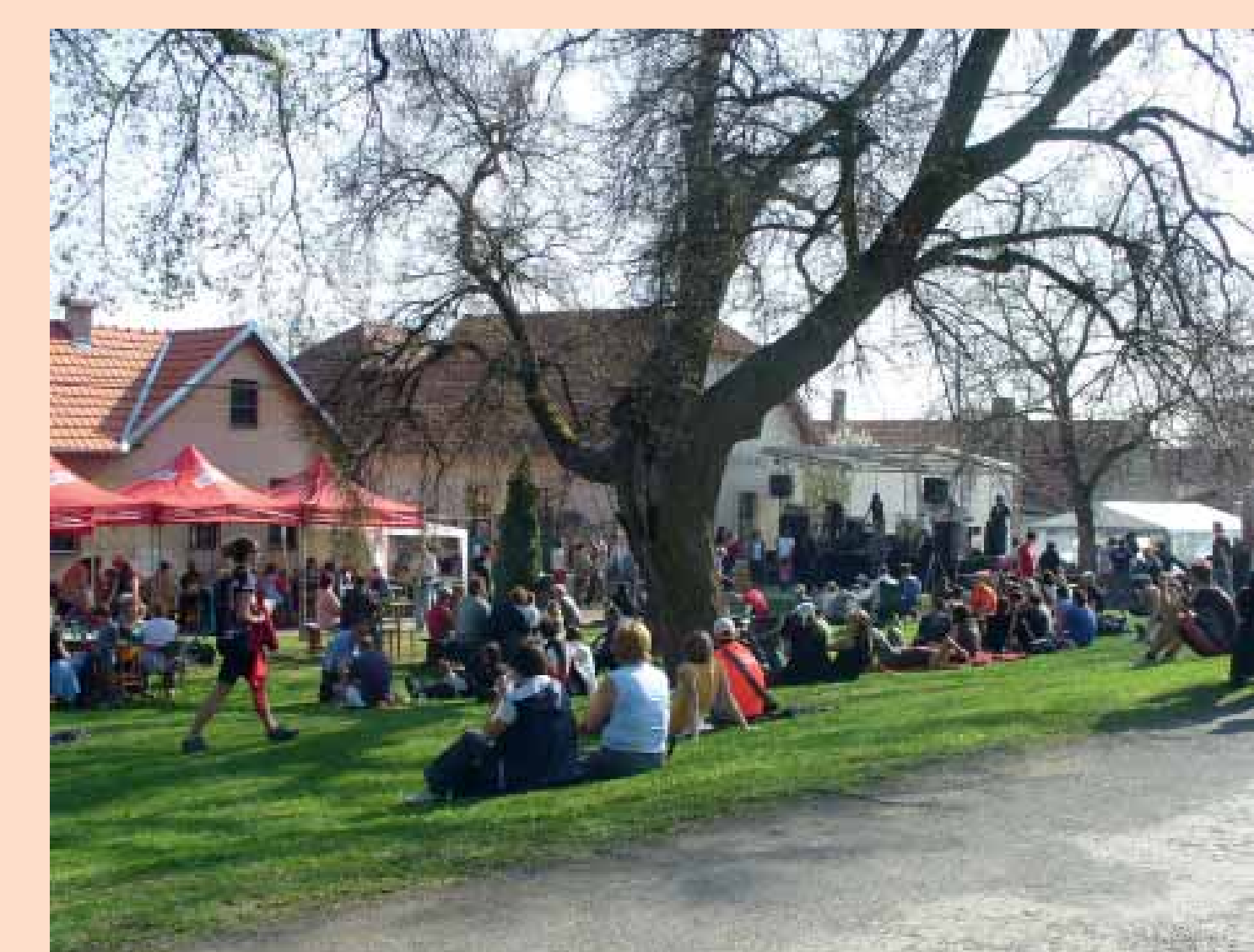
Jarní festival Mořinka FEST